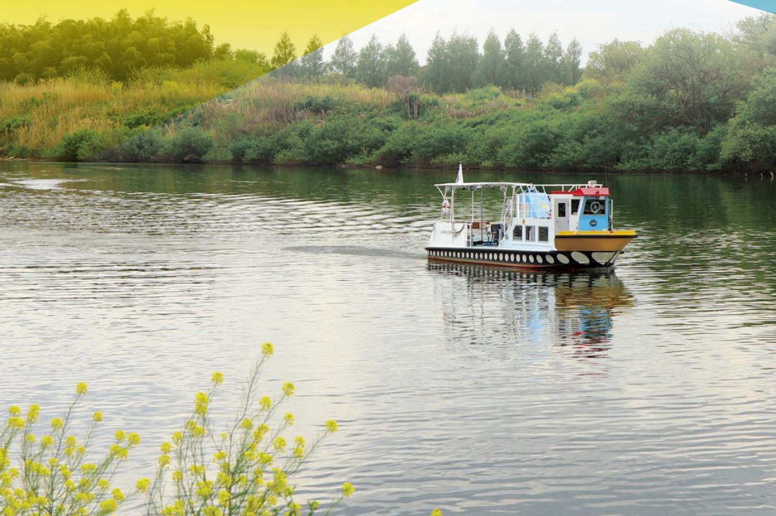
おおほり 小堀の渡し(利根川渡し船) 利根川の渡し船で、現在は観光船 として運行中の「小堀の渡し」