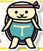
取手市健康づくり キャラクター 「とりかめくん」