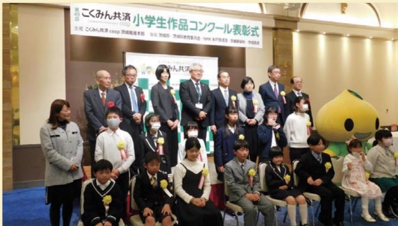
小学生作品コンクールにて受賞された皆さん

こどもの成長応援プロジェクト 「こどもの成長応援プロジェクト」サイト内で、 子どもの成長に関わるさまざまな情報を発信しています。 https://www.zenrosai.coop/anshin/kenko