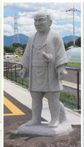
道の駅グランテラス 尊徳像