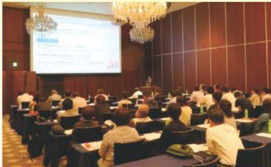
セミナー会場の様子

② iDeCo (個人型確定拠出年金) ってなに？ ③ つみたてNISA ってなに？ ④ 投資信託 基本のき ⑤ iDeCo とつみたてNISA の使いわけ ⑥ 値動きと上手く付き合いながらコツコツ増やす3つのポイント」のテーマで講演をいただきました。講演終了後の個別相談やアンケート