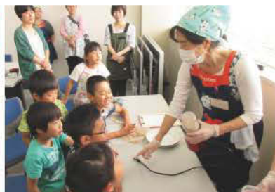
大豆からなにができるかな