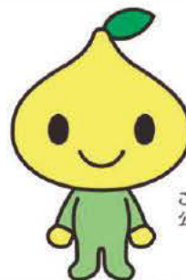
こくみん共済 coop 公式キャラクター ヒットくん