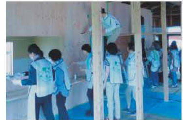
壁を塗装しました

2018 年 4 月には同敷地内に多文化保育所「はじめてのいっぽ保育園」(認可外小規模多文化保育施設)が開園しています。