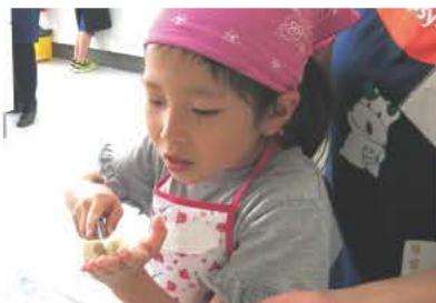
手の上でお豆腐を切ります

小学校低学年の子どもたちを対象に開催。包丁などの調理器具の使い方から、お米の研ぎ方や野菜の切り方を学びながら「一汁二菜」の和朝食作りに挑戦しました。料理の楽しさとともに健やかな体づくりに必要なバランスよく食べることの大切さを学びました。