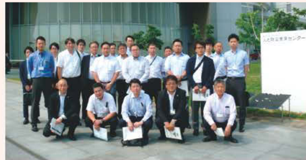
人と防災未来センターにて(神戸市)