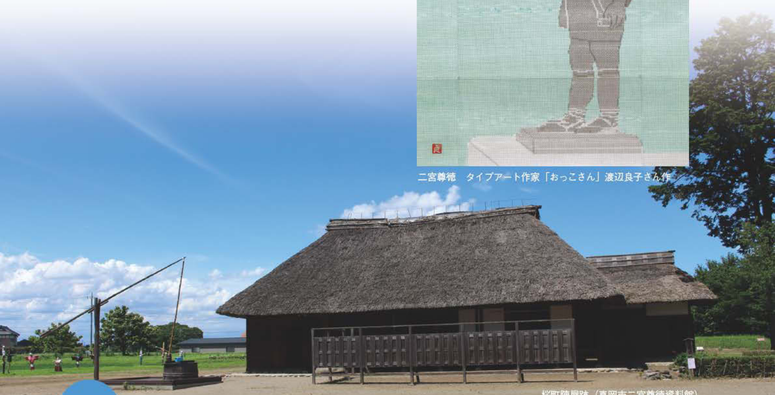
桜町陣屋跡 (真岡市二宮尊徳資料館)