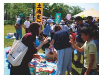
「チャリティーダーツ」の一コマ

引き続き、土浦労福協として会員相互の交流を図りながら、地域や職場から労働福祉活動を身近に感じられる地域に根差した取り組みを展開していきますので、ご理解とご協力をお願いするとともに、多くの皆様の参加をお待ちしております。