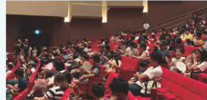
ひたちなか市文化会館

お子さま向けにドラえもん「のび太の月面探査記」を上映し、県内4会場で多くのご家族に観覧いただきました。