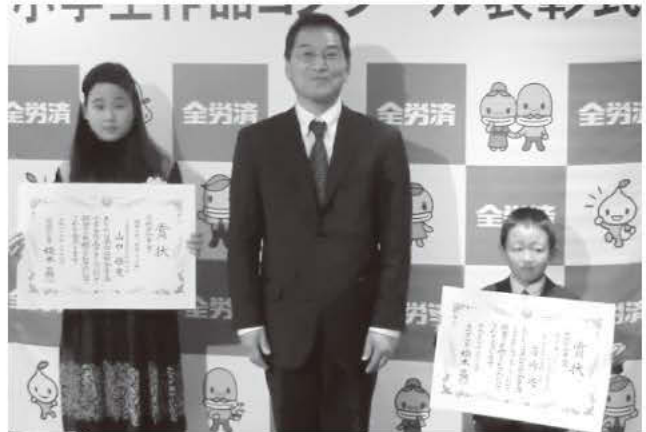
〈作文・版画〉茨城県知事賞の子供たち