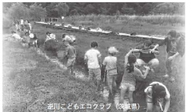
逆川こどもエコクラブ (茨城県)

全労済では、様々な助成団体によって、人と人との絆が強まりコミュニティの形成、発展および再生につながることを期待し、今後も継続していきます。