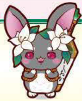
噂(たしな)みうさぎ モモア ©石岡市