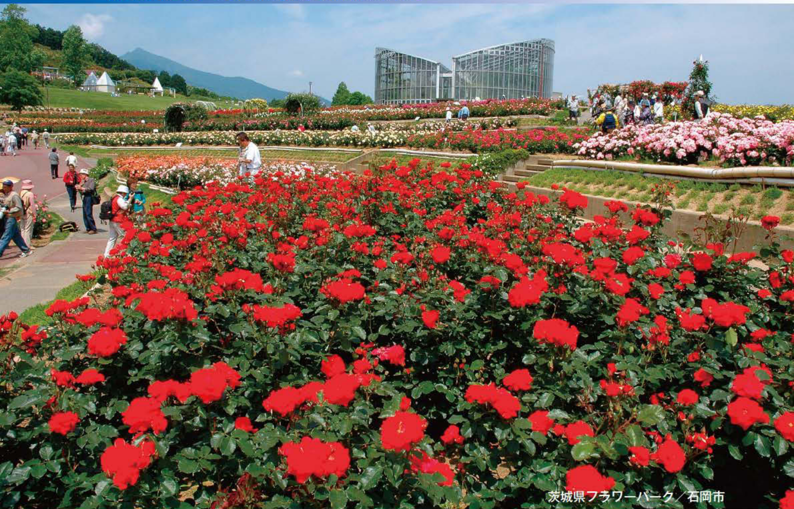
茨城県フラワーパーク / 石岡市