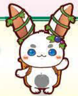
満喫うさぎ カイ