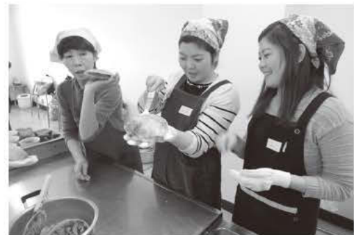
「浜の母さん料理教室」